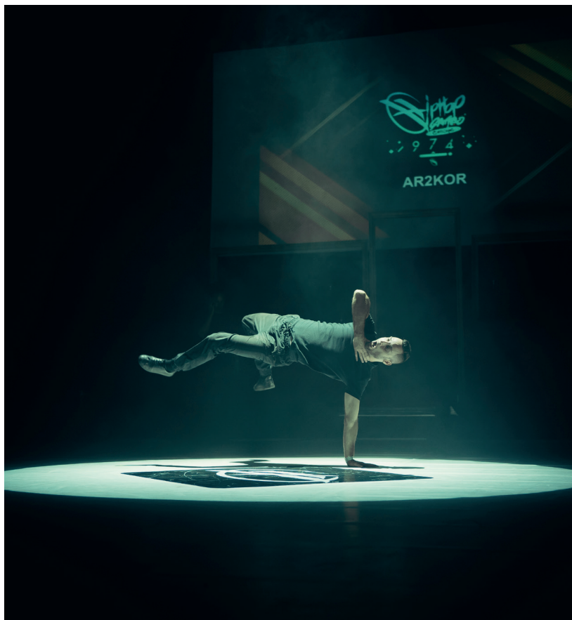
↑ Hip-Hop Games Cie Art-Track

studies filosofie en cinema in Parijs op een carrière achter de schermen. In de jaren '80 maakt hij zijn eerste kortfilms, waaronder Carne . Enkele jaren later waagt hij zich aan langspeelfilms, met bijvoorbeeld Irréversible (2002) met Vincent Cassel en Monica Bellucci.